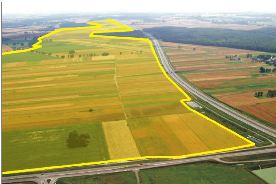
Strefa Aktywności Gospodarczej (SAG) – „węzeł Olszowa”

Wykorzystując istniejące zasoby, a w szczególności autostradę A4 z dwoma węzłami i aktywność mieszkańców, gmina w 2000 roku wyznaczyła sobie jako kierunek działania gospodarczy rozwój małej i średniej przedsiębiorczości. Realizując to zamierzenie dokonano zmiany w planie zagospodarowania przestrzennego dla obszaru położonego pomiędzy węzłem „Olszowa” i „Nogowczyce” o pow. 325 ha na przemysłowe, usługowo-produkcyjne, magazynowo-składowe, obsługi komunikacji samochodowej, usług handlu i gastronomii. Obecnie teren ten jest uzbrajany pod kątem oczekiwań przyszłych inwestorów.