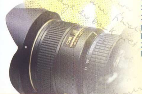
FOTO- und LITERATUR WETTBEWERB FÜR AMATEURE

ZNACZENIE NIEMIECKO- POLSKIEJ DWUJĘZYCZNOŚCI w moim życiu